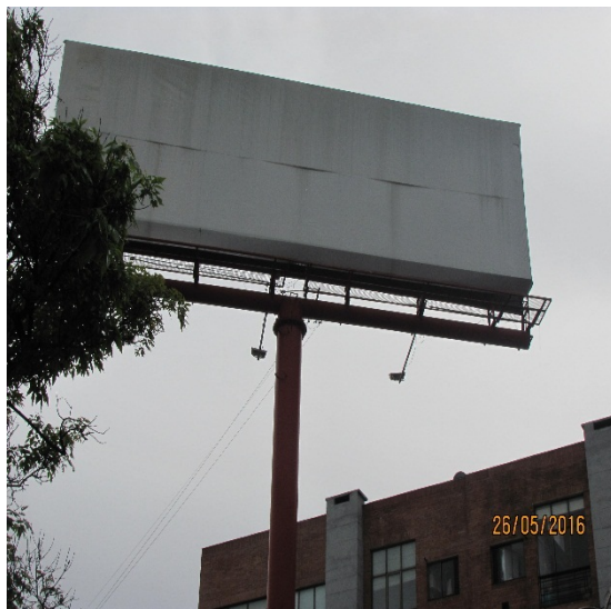
Foto 2. Texto de la Publicidad